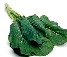
Vegetales Verdes Col, Mostaza, Nabo Verde