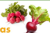
Rábanos y Remolachas